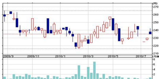
英和株価チャート